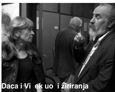
Daca i Vi ek uo i žiriranja