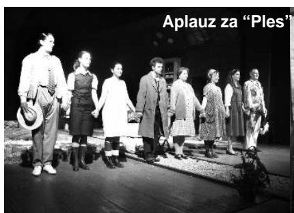
Aplauz za "Ples"