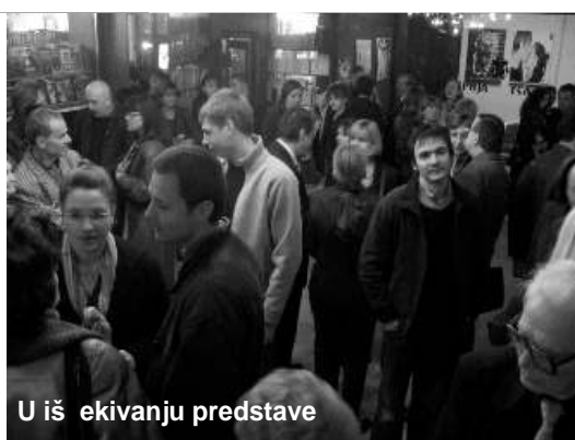
U iš ekivanju predstave