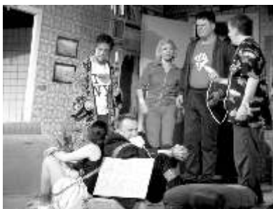
Scena iz predstave "Paradoks"

svi ostali elementi predstave), da se prevaziđene nešto što se zove "separatah koncentracija". Oni ansambli koji su to uspjeli, dakle znali zašto neki tekst biraju, razvijaju u pri tom vezu između drugih umetnosti - muzika, pokret, mimika - upravo su dokaz da se vojvođansko glumište i vojvođansko pozorište nalazi u aktualnoj životnoj poziciji."