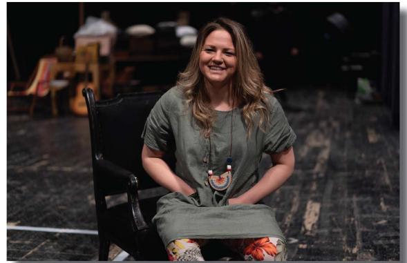
ФОТО: Владимир Величкович

Имам утисак да се 50 година након њене смрти није много тога променило. Само су се ствари пребликовале у нешто друго и ми сада имамо проблем са квазиеманципацијом, са статистичком еманципацијом, а не суштинском, а Џенис се баш борила за то суштинско прихватање у друштво. Морам бити свесни да је она живела у време сегрегације у Америци, у време када је женама било забрањено да носе панталоне и имају каријеру. Она је рушила све стандарде, а ја тренутно имам утисак да се од жене и дан данас у Србији очекује да се