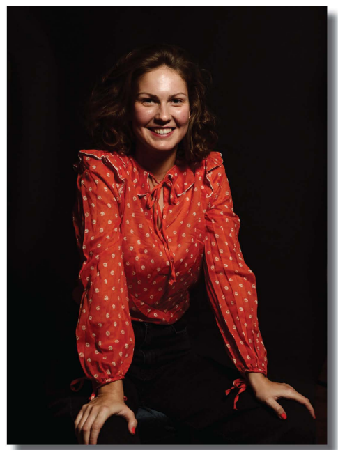
ФОТО: Мила Пејић